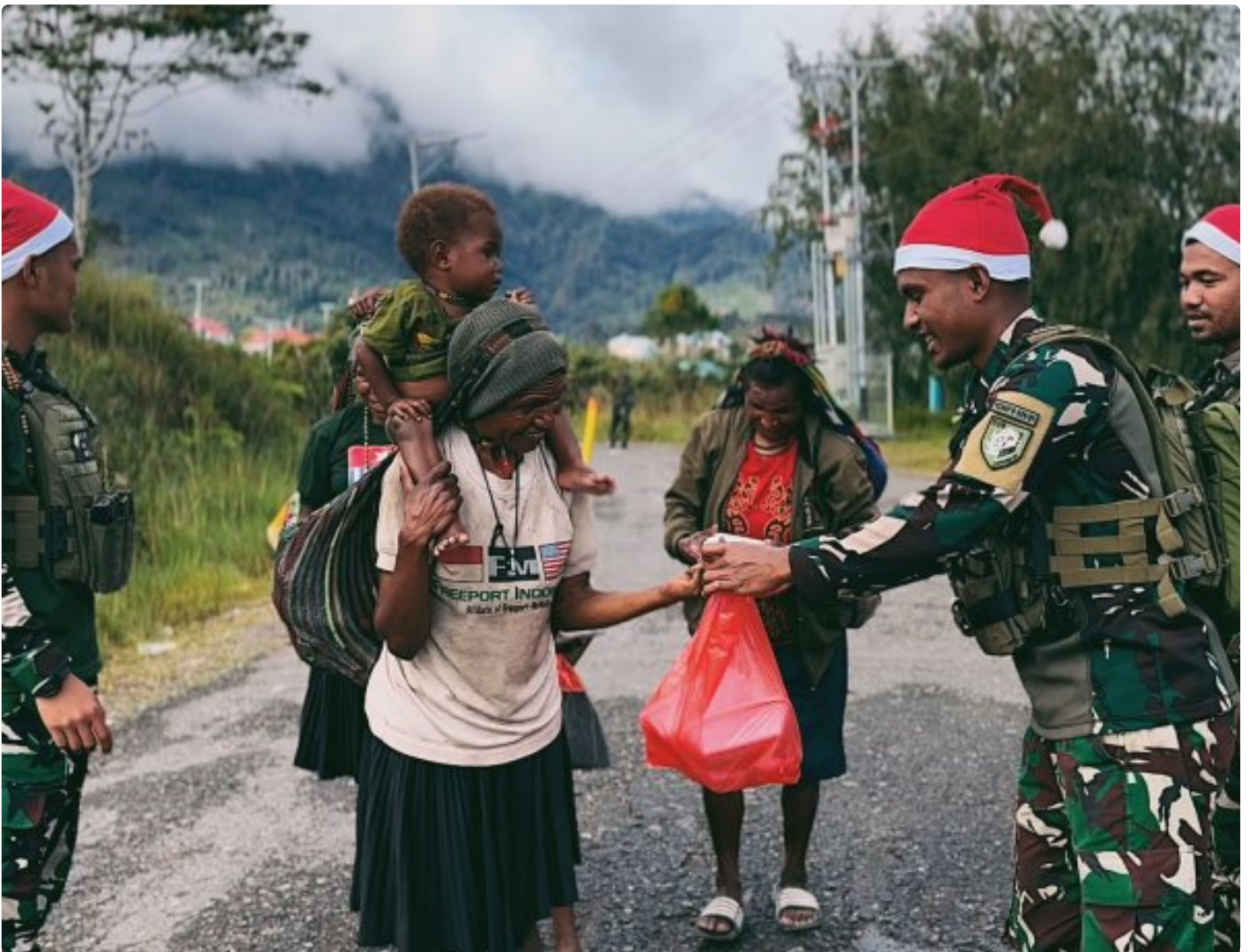
Foto: Satgas Yonif 509 Kostrad memberikan makna baru pada patroli keamanan dengan berbagi kebahagiaan bersama masyarakat di Intan Jaya, Papua.