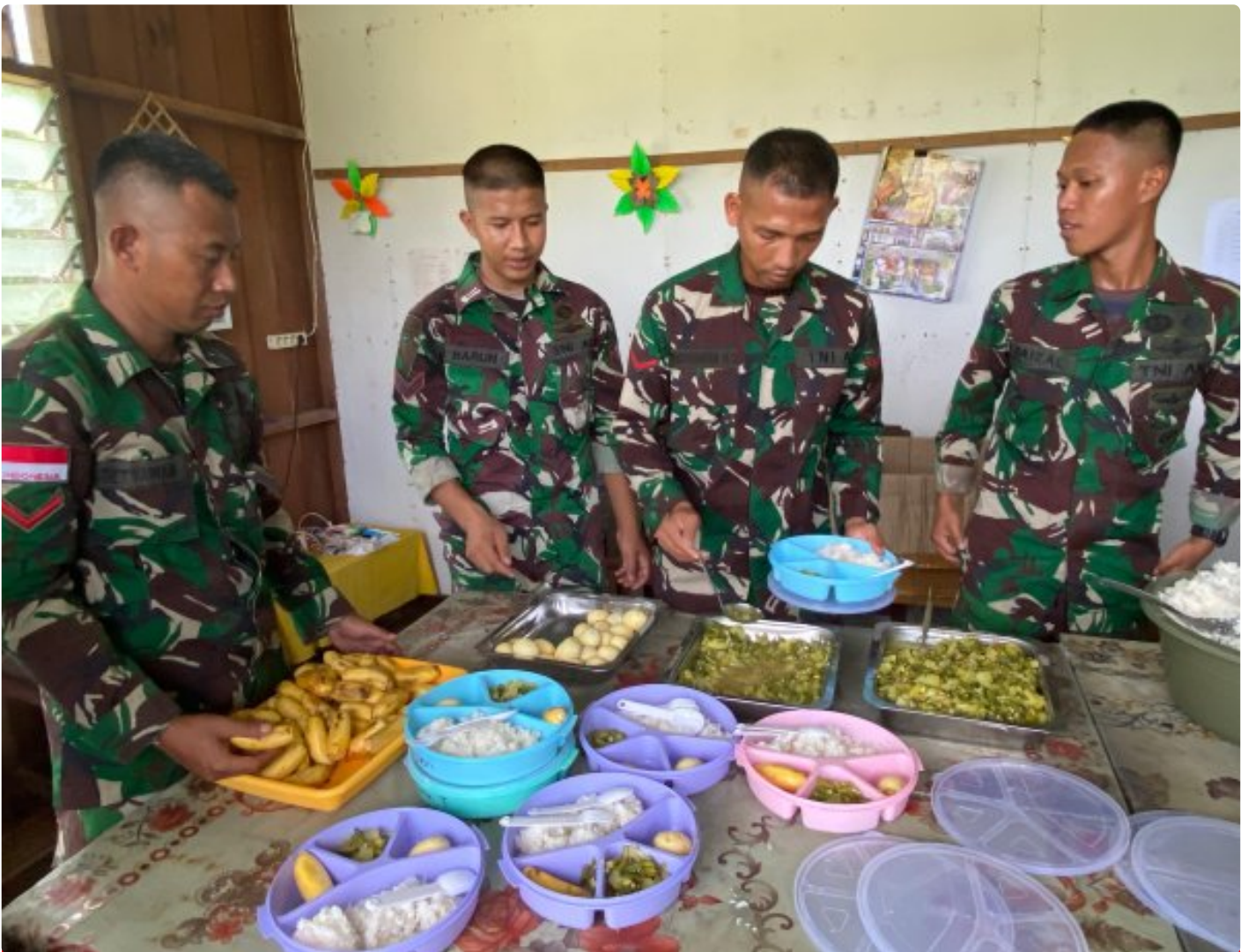
Foto: Dedikasi Satgas Pamtas Mobile RI-PNG Yonif 503/Mayangkara dalam mendukung program makan bergizi gratis pemerintah mendapat apresiasi tinggi dari masyarakat Distrik Krepkuri, Kabupaten Nduga, Papua, di sekolah rimba, Rabu (29/01/2025).